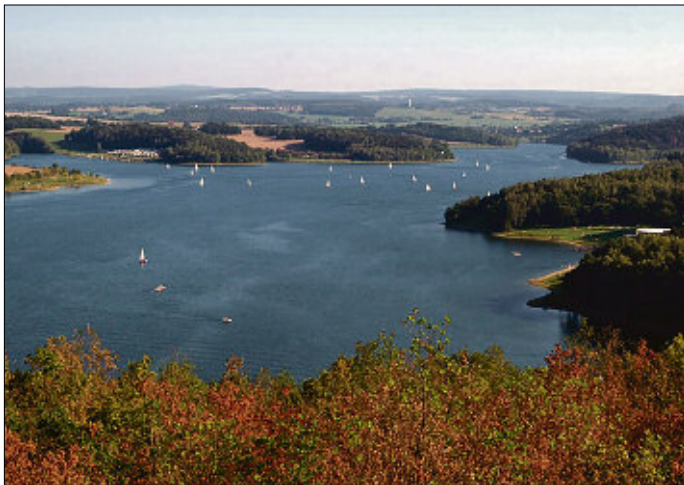
26 Freibäder und drei Badgewässer warten auf sommerhungrige Badegäste aus Nah und Fern.

Darüber hinaus können die Untersuchungs- und Messergebnisse während der Badesaison auch unter www.gesunde.sachsen.de/badegewaesser.php nachgelesen werden.